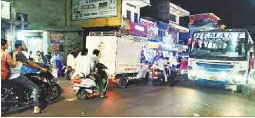
शहर में जाम टैफिक जिससे लोगों को हो रही परेशानी।

खासकर बाजार दिवस के दिन सबसे ज्यादा जाम की स्थिति कई बार यहां पर बनती रहती है और लोग परेशान होते रहते हैं। इस तरह की स्थिति लंबे समय से बनी हुई है, जिसका समाधान अब तक नहीं निकल पाया है। रविवार को शाम ढलने के बाद चिरमिरी चौक पर जाम की स्थिति बनने के कारण बिलासपुर मार्ग पर भवानी तिगड्डा से आगे तक, चिरमिरी चौक से