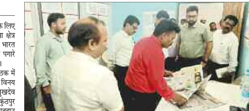
व्यवस्थाओं का जायजा लेते प्रेक्षक।