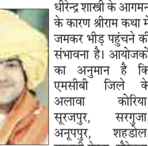
धीरेन्द्र शास्त्री के आगमन के कारण श्रीराम कथा में जामकर भीड़ पहुंचने की संभावना है। आयोजकों का अनुमान है कि एमसीबी जिले के अलावा कोरिया, सूरजपुर, सरगुजा, अनूपपुर, शहडोल, इसके लिए पण्ड्रा, गौरल्ला, कोरबा सहित अन्य जगहों से भी काफी संख्या में श्रीराम कथा में शामिल होने लोग पहुंच सकते हैं। शहर में पहली बार वृहद स्तर पर कोई धार्मिक कार्यक्रम आयोजित किए जा रहे हैं, इसके लिए व्यापक स्तर की तैयारियां भी चल रही है। वहीं चिरमिरी शहर में पहली बार बागेश्वर धाम प्रमुख पंडित धीरेन्द्र शास्त्री का आगमन हो रहा है। उल्लेखनीय है कि पूर्व में बागेश्वर धाम प्रमुख धीरेन्द्र कुमार शास्त्री का कार्यक्रम कोरिया जिले में अप्रैल महीने में वृहद कार्यक्रम होने की चर्चाएं थी।

द्वारा श्रीराम कथा में भारी भीड़ की संभावना को देखते हुए यातायात व्यवस्थित करने के लिए रूट चार्ट एवं पार्किंग की व्यवस्था बनाने के लिए अंतिम रूप दे दिया है। संभावना है कि बागेश्वर धाम प्रमुख पंडित धीरेन्द्र शास्त्री के आगमन के कारण श्रीराम कथा में जामकर भीड़ पहुंचने की संभावना है। आयोजकों का अनुमान है कि एमसीबी जिले के अलावा कोरिया, सूरजपुर, सरगुजा, अनूपपुर, शहडोल, इसके लिए पण्ड्रा, गौरल्ला, कोरबा सहित अन्य जगहों से भी काफी संख्या में श्रीराम कथा में शामिल होने लोग पहुंच सकते हैं। शहर में पहली बार वृहद स्तर पर कोई धार्मिक कार्यक्रम आयोजित किए जा रहे हैं, इसके लिए व्यापक स्तर की तैयारियां भी चल रही है। वहीं चिरमिरी शहर में पहली बार बागेश्वर धाम प्रमुख पंडित धीरेन्द्र शास्त्री का आगमन हो रहा है। उल्लेखनीय है कि पूर्व में बागेश्वर धाम प्रमुख धीरेन्द्र कुमार शास्त्री का कार्यक्रम कोरिया जिले में अप्रैल महीने में वृहद कार्यक्रम होने की चर्चाएं थी।