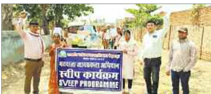
मतदाता जागरूकता रैली में शामिल विद्यार्थी व अन्य।